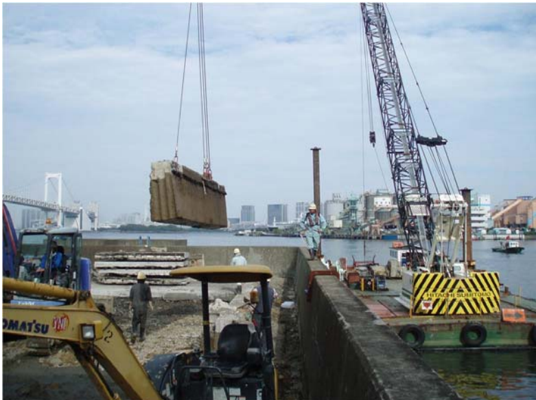
ダイヤモンドコア孔明け工事