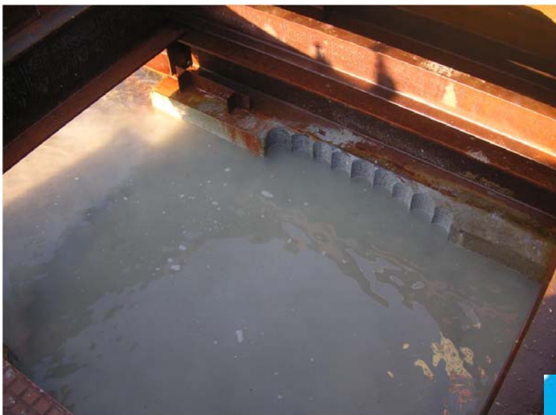
ダイヤモンドコア孔明け工事