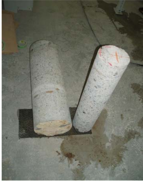
ダイヤモンドコア孔明け工事