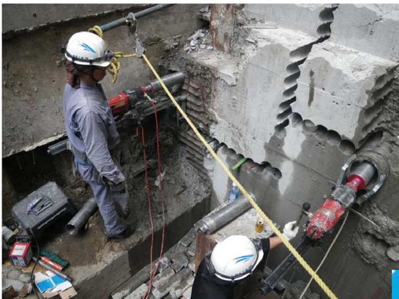
ダイヤモンドコア孔明け工事