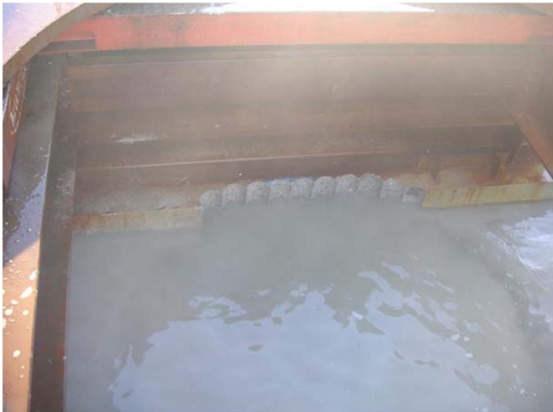
ダイヤモンドコア孔明け工事