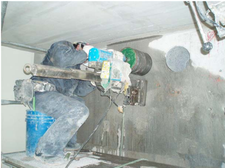
ダイヤモンドコア孔明け工事