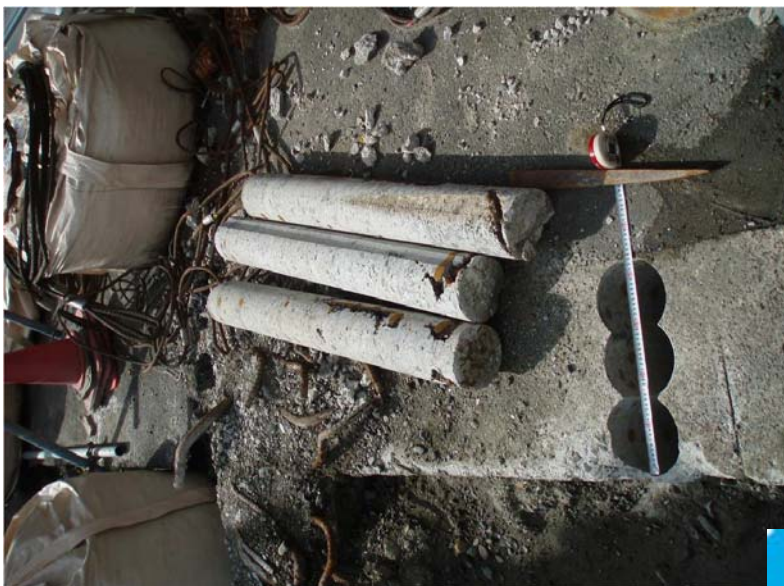
ダイヤモンドコア孔明け工事