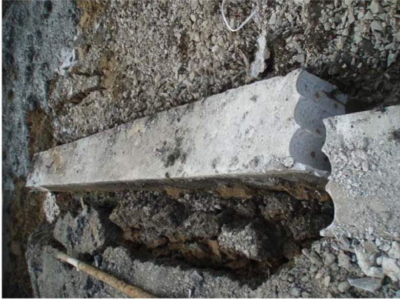
ダイヤモンドコア孔明け工事