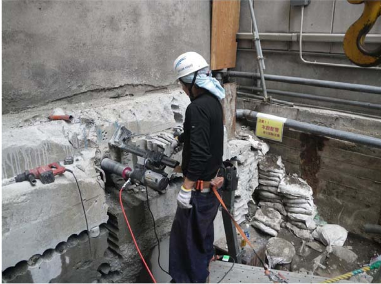
ダイヤモンドコア孔明け工事